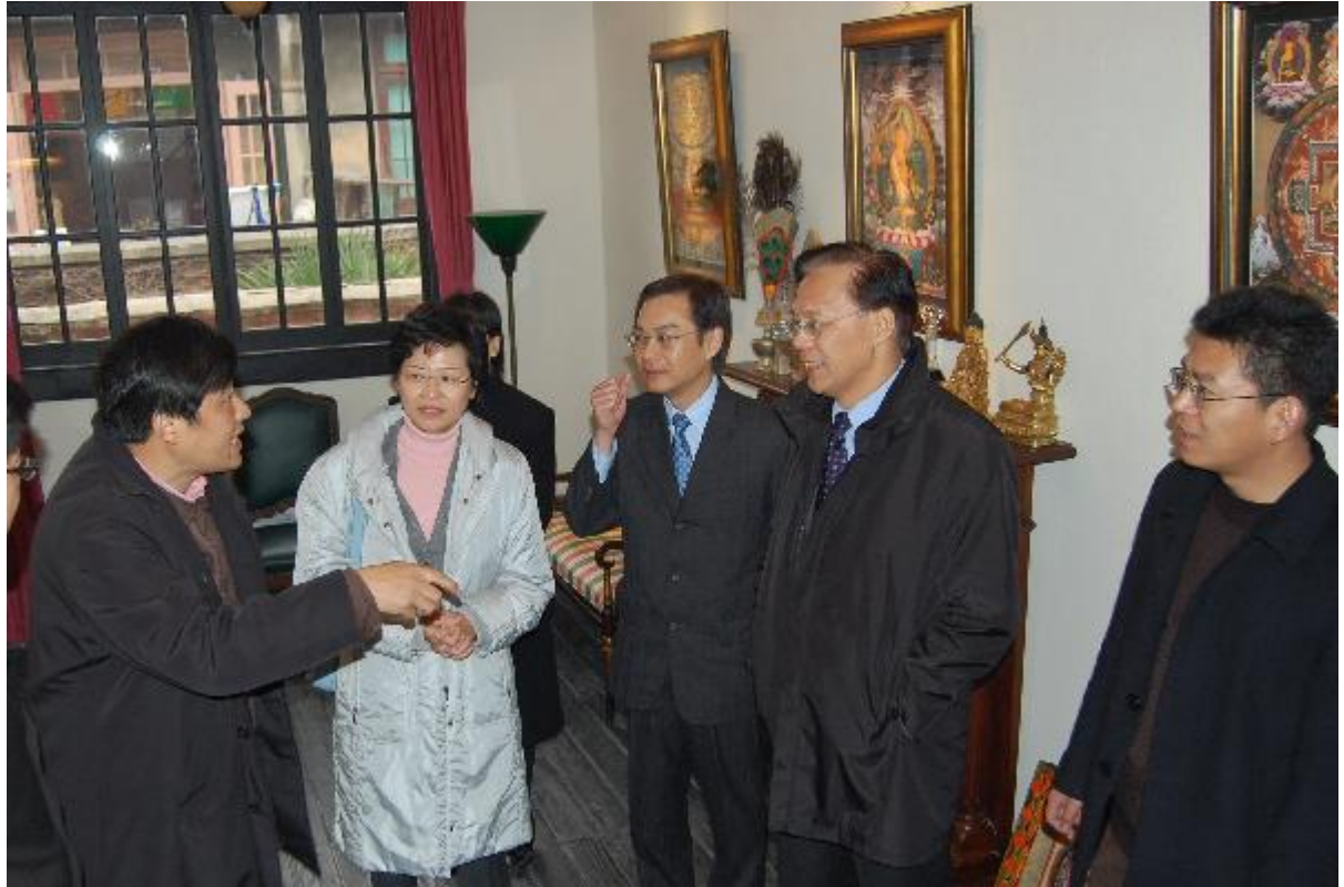
發展局局長林鄭月娥和發展局常任秘書長（工務）麥齊光(右二) 參觀「田子坊」內一間工藝特色商店。