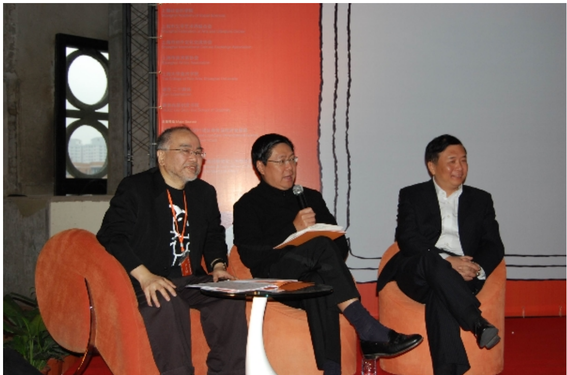
商務及經濟發展局局長馬時亨（中）在「香港創意」交流研討會上，就如何加 香港、上海及長三角的創意產業合作，和與會者交流意見。