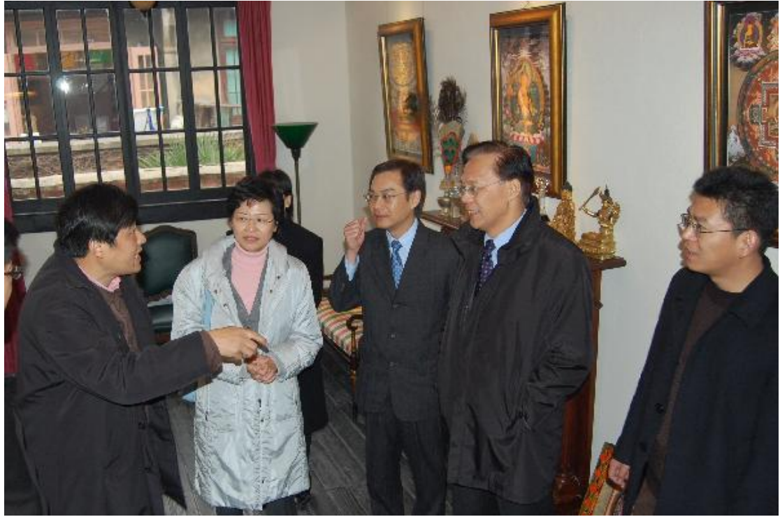
发展局局长林郑月娥和发展局常任秘书长（工务）麦齐光（右二）参观「田子坊」内一间工艺特色商店。