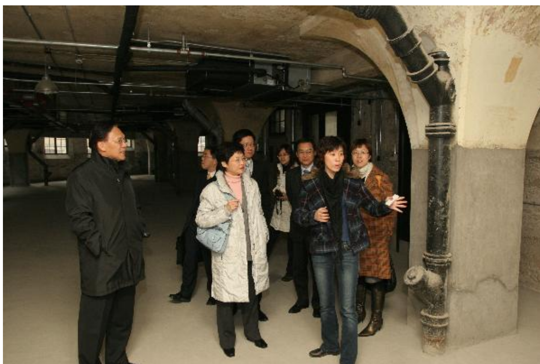
发展局局长林郑月娥和发展局常任秘书长（工务）麦齐光(左)聆听有关「老场坊」的历史介绍。